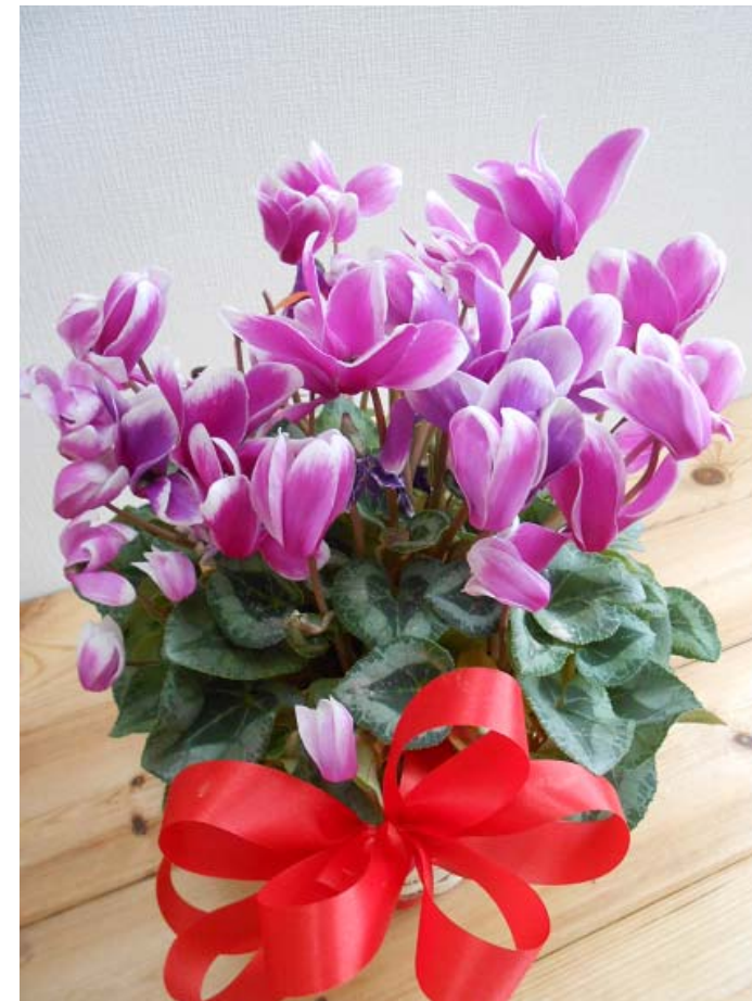
グループホームすぎの子

師走に入り急に寒さが厳しくなりました。十一月の記録的な暖かさにのんびりしていた体がびくつきだしていませんか？そろそろインフルエンザや感染性胃腸炎が流行する時期です。手洗い・うがいを励行してしっかり予防しましょう。 残り一カ月を切った二〇一五年を元気に過ごしたいですね。