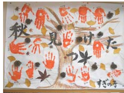
利用者の皆さんの手形で作ったもみじ