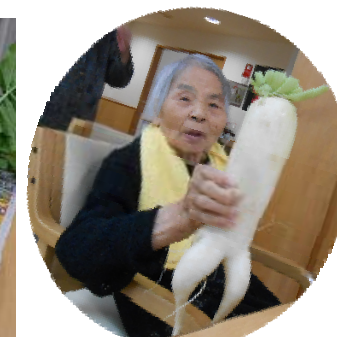
わあ～、こりやあまたどうして！