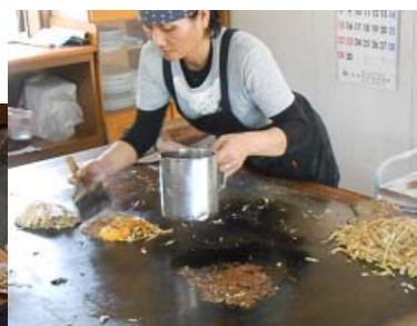
大きな鉄板でジュージー。素早いヘラさばきはさすがプロ！