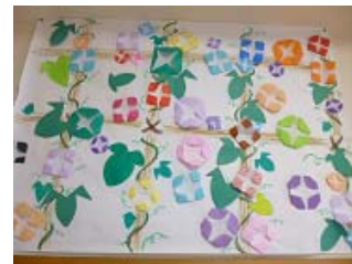
利用者・スタッフが協力して作成した朝顔