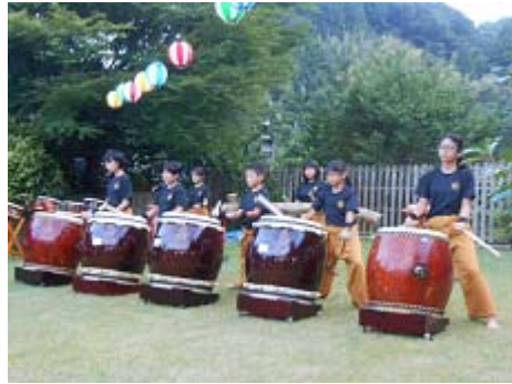
伊岐佐太鼓 ～ 勇壮な演奏です