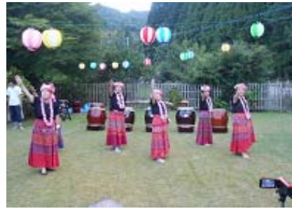
フラダンス ～ プルメリアの皆様