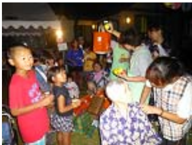
福引き 何が当たったかな～？