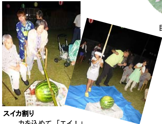
スイカ割り 力を込めて「エイ！」