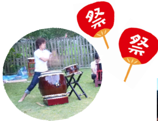
目にもとまらぬバチさばき