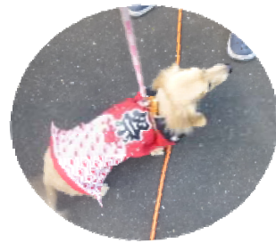
ワンちゃんも祭りのコスチュームで参加