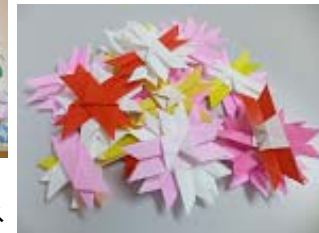
現在作成中のコスモス

すぎの子では折り紙を使って季節の風物を表した作品を作っています。夏は朝顔を飾りました。現在は秋に向けてコスモスを作成中。朝顔に比べ細工が細かく大変ですが、もともと手仕事がお好きなお母様たちです、根気強く少しずつ作っていただいています。そのうち模造紙一杯にコスモスが咲き乱れることと思います。乞う！ご期待。