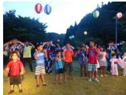
妖怪体操 スタッフの出し物に子供たちが飛び入り参加