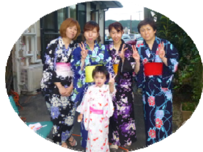
浴衣5人娘 すぎの子のキレイどころ？が勢揃い