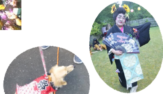
なんちゃって花魁 実はご家族様。ちんどん屋活動をなさっていて、会場を盛り上げて