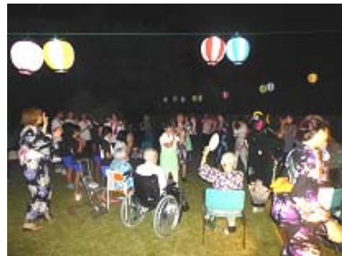
盆踊り&フォークダンス