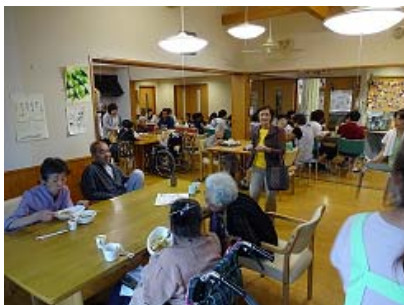
お食事はカレーライス 82名の参加で テイルームは超満員