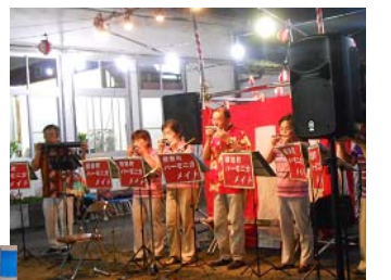
ハーモニカメイトの皆さん