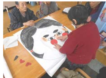
「ほっぺたはこのあたりかな？」

まだまだお正月気分が残る9日、皆様と福笑いをしました。まわりのアドバイスを聞きながら目、鼻、口を置いていくのですが、目隠しを外した途端大爆笑ヽ(^o^)