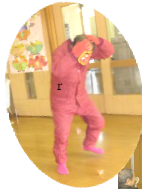
まいったよお～ 利用者の皆様に豆を当てられ小さくなった赤鬼さん

今年の節分の催しは、節分の由来や豆まきの理由を紙芝居でお話したあと、鬼退治を入居者の皆様にやっていただきました。