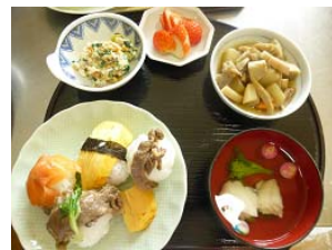
恵方巻きならぬ手まり寿司 職員が知恵を絞リサーモン、牛肉、卵焼きの三種類を作りました。味も見た目も100点！