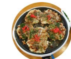
目の前で作れば、ジュージュー焼ける音やおいもごちそうです。

焼きそばも用意していたのですが、お好み焼きでお腹はパンパン。次回のワイワイご飯に持ち越しとなりました。