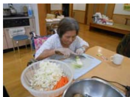
手間がかかるみじん切りも大勢でやれば早いものです。

みんなでワイワイ騒ぎながら賑やかにご飯を食べよう！（略してワイワイご飯）と、8月のそうめん流しに続き、第2弾はお好み焼きを企画しました。病院受診やリハビリがなくのんびりした日曜日、利用者の方には準備にも参加していただきました。