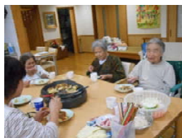
ホットプレートを囲んでの食事