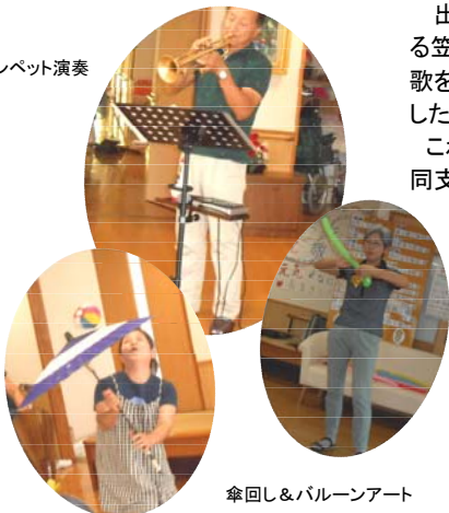
傘回し&バルーンアート