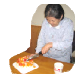
誕生ケーキを ご自分でカット