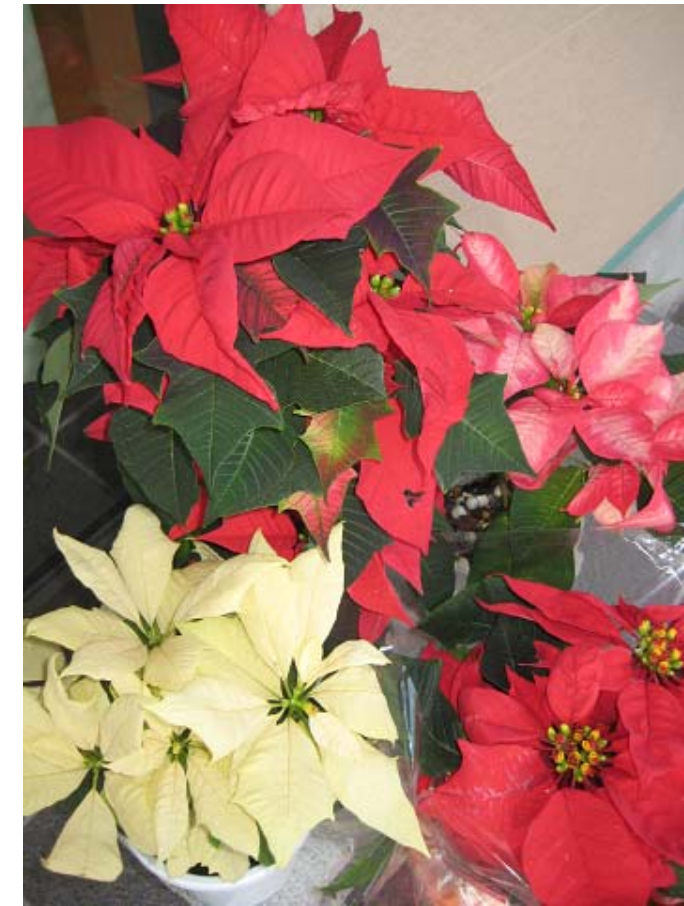
グループホームすぎの子

カレンダーが残り一枚となりました。暖かい十一月でのんびりしていたのに、掃除や年賀状などなど、お正月の準備がいつぱんに気になります。あせらず、あわてず、できるところから片付けていきましょう!寒さが本格化してきました。くれぐれも風邪にご注意ください。