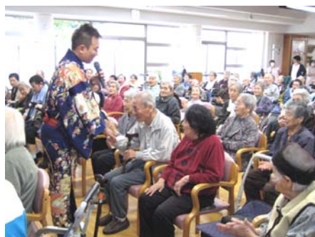
客席を回って1人1人と握手

近くのアメニティきゅうらぎさんや宇都宮病院さんからよく行事参加のお誘いをいただき、ありがたい限りです。これからも、相互に交流を図り、協力関係を深めていきたいと思ひます。