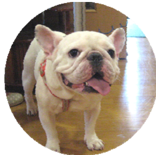
珍客来訪 名前は“きなこ” フレンチブルドッグの 女の子です。