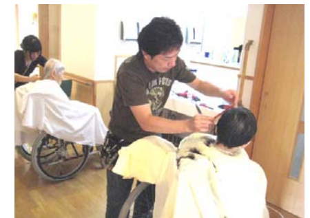
髪をあたられるとみなさん気持ちよさそうです。

2ヶ月に1度ホームを訪問、利用者の髪の毛をカットしていただいています。店長さんのお父様の代から巖木町本山で理髪店をなさっていて、利用者の中にはお父様がカットなさっていた方も。介護に対する知識もお持ちで、利用者に対し穏やかに対応してくださいませ。