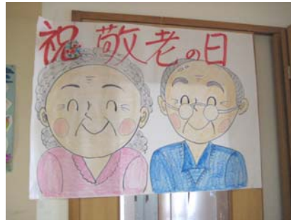
スタッフ手書きのポスター

現在、すぎの子利用者の最高齢は97歳、平均年齢85.7歳です。激動の昭和を生きてこられた皆さん、多くのご苦労があったことと思います。いつも「昔はそんな便利なものはなかった。」「姑さんが厳しかった。」など、お話を聞かせてくださいます。長年にわたり社会につくした皆さんに感謝し、ますますお元気に過ごせるよう、支援してまいります。