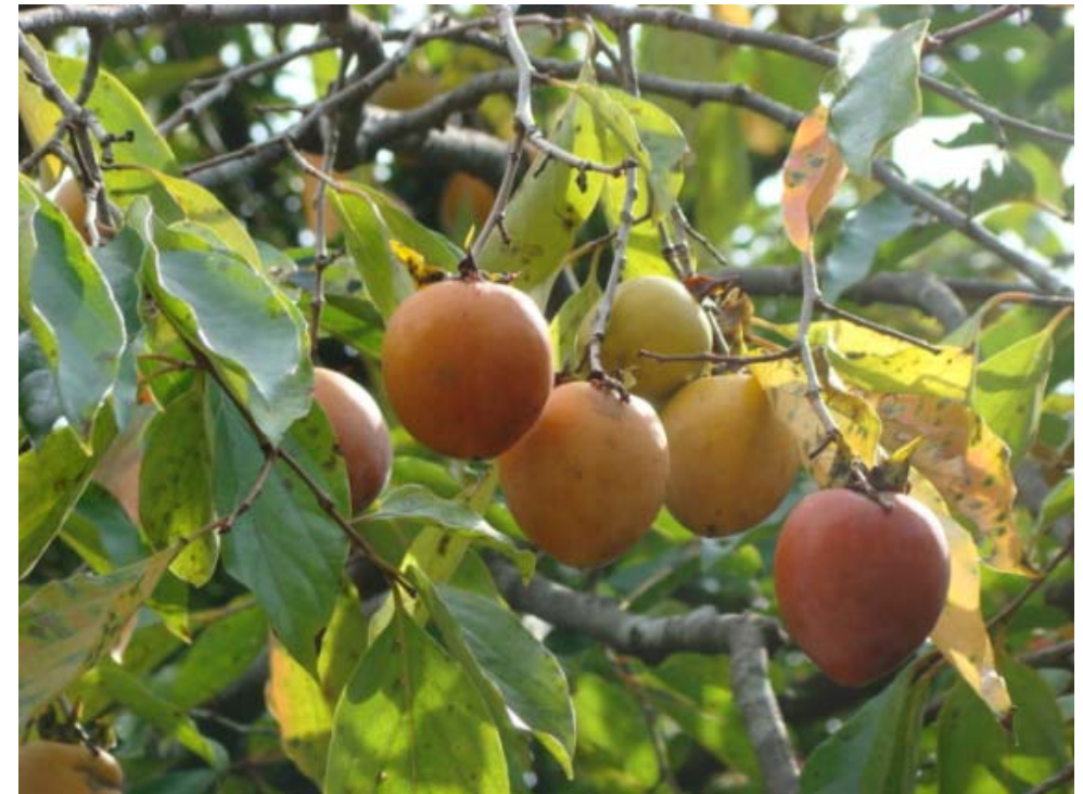
グループホームすぎの子

梨、ブドウに続き、柿や栗が目につくようになりました。残暑が続くなかでも少しずつ秋が深まっていますね。各地で秋祭りが開催される10月、さわやかな秋空のもと、元気に出かけていきましょう！