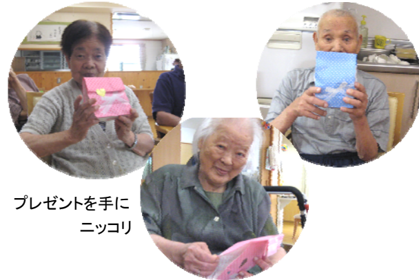
プレゼントを手にニッコリ