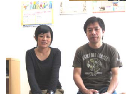
店長さんとそのお嬢さん。