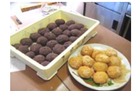
手作りおはぎの味は抜群！