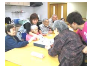
紙相撲 思わず立ち上がり土俵をたたきます

29日 ホームシアター設置 …… テレビ、ブルーレイレコーダー、アンプ、スピーカーを設置。テレビ台も高さがあるのに替え、大勢で映画や時代劇を楽しめるようになりました。