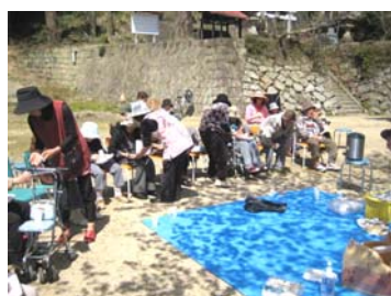
桜の木の周りでお弁当

3月22日佐賀市や福岡市に開花宣言が出されたものの、まだまだ風が冷たく、外でのんびりお花見の雰囲気ではありませんでした。「早く行かないと散ってしまう!」と「まだまだ。」の気持ちが交錯し、毎日桜の花とお天気が気になって仕方ありません。悩んだかいあって、週間予報で「この日しかない!」と決断した日は、朝から抜けるような青空と暖かな気温となり、花見には絶好のお天気。ホーム総出ですぎの子近くの白山神社へ出かけました。全員揃っての外出は久しぶりです。