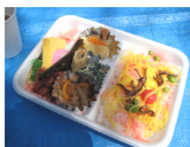
お弁当はちらし寿司