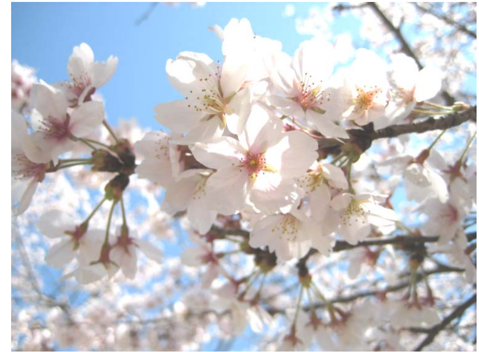
巖木町岩屋白山神社

足踏みをして、なかなか前進しなかった春が漸くやってきましたね。風が温み、ぽかぽか陽気のなか、桜、チューリップ、桃などなど…美しい花を眺めていると、ふわあ〜と気分が軽くなります。4月は新しいスタートの月です。足どり軽く、進んでいきましょう！