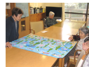
絵手紙教室作品 ～ 私の魚はどこかしら?