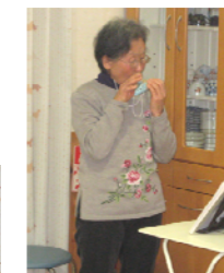
琴とオカリナの演奏

…… 1月は3の方が誕生日を迎えられました。白寿を迎えた入居者のご家族がオカリナと琴の演奏を披露してくださいました。