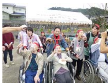
パン食い競争 ～ 思わず手が出て しまいます

10月15日ハーモニカサークル響の皆様が来所され、懐かしいメロディーを聞かせてくださいました。ハーモニカの優しい音色をきくと歌が自然に口から出てきます。素敵な音楽を聞かせてくださったお礼に最後はすぎの子の皆様から「北国の春」の歌をプレゼントしました。