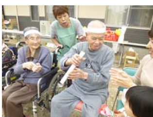
バトンリレー ～ 急がねば負けるばい！