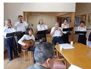
ハーモニカサークル 響 の皆様

10月15日ハーモニカサークル響の皆様が来所され、懐かしいメロディーを聞かせてくださいました。ハーモニカの優しい音色をきくと歌が自然に口から出てきます。素敵な音楽を聞かせてくださったお礼に最後はすぎの子の皆様から「北国の春」の歌をプレゼントしました。