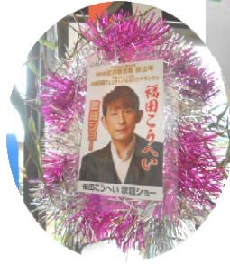
福田こうへいさんがすぎの子にきてくれますように！