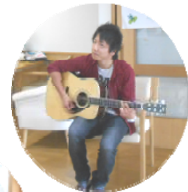
素敵な生演奏を聴かせていただきました。