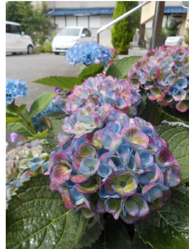
グループホームすぎの子

どんよりしたお天気がつづいています。局地的な集中豪雨で被害がでている地域がありますが、すぎの子周辺では、ちょうど良い感じ。時折降る雨は大地を湿らせ、豊かな水の恵みをもたらしてくれる事でしょう。例年だと梅雨明けは7月20日前後、暑い夏はもうすぐです。