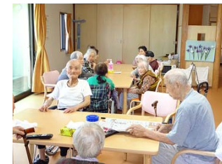
すぎの子成和の入居者と談笑