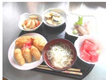
父の日の献立 いなり寿司、お刺身、がめ煮、野菜天ぷら、スイカ