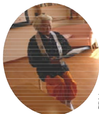
大黒舞とかんねさんの読み聞かせ