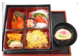
お祝い膳 …… お刺身、ちらし寿司、酢の物、野菜煮しめ