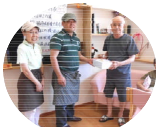
パン屋さん“ソラシド”からパンをいただきました。