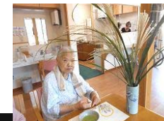
ススキを飾ってお茶会

すぎの子石志ではお昼に観月のお茶会を開き(夜に抹茶を飲んで眠れなくなるといけないので……)、夜はデッキに出て月をゆっくり眺めました。皆様からは「ほら、ほら、きれいかよ。」とか、「良か月ば見た。」との感想が聞かれていました。