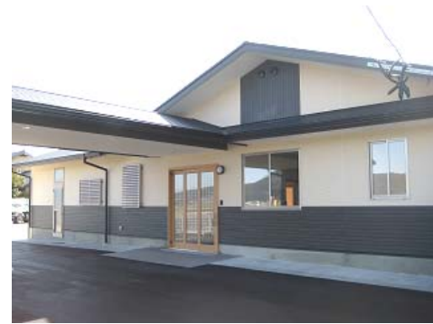
グループホームすぎの子

多くの方のご協力を得て、グループホームすぎの子石志をスタートさせることができました。関係者の皆様に深く感謝いたします。やっと歩み出したホームがしっかりと根を張り、大きな木となるよう、職員が一丸となり、良質な介護サービスの提供に努めてまいります。どうぞこれからもすぎの子石志をよろしくお願いいたします。