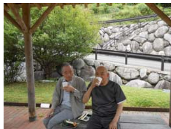
七山 鳴神の庄でお弁当を買い、外で昼食

雨が続いてうっとうしい6月、家の中ばかりでは気分も晴れません。というわけで、貴重な晴れ間にお出かけしました。