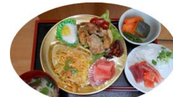
父の日の昼食はちらし寿司にお刺身