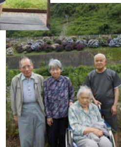
桜の木がたくさんあり、春には桜見物に来ようと約束してきました

21日は相知町医王寺のあじさいと佐里温泉のサルビア、26日は七山のあじさいの見物です。どこのお花も美しく、良い気分転換になったようです。なんといってもホームにお帰りになったときの「ただいま！」の声元気なこと。表情も生き生きとされています。これからも外出の機会を設けて、皆様に元気になっていきたいと思っています。